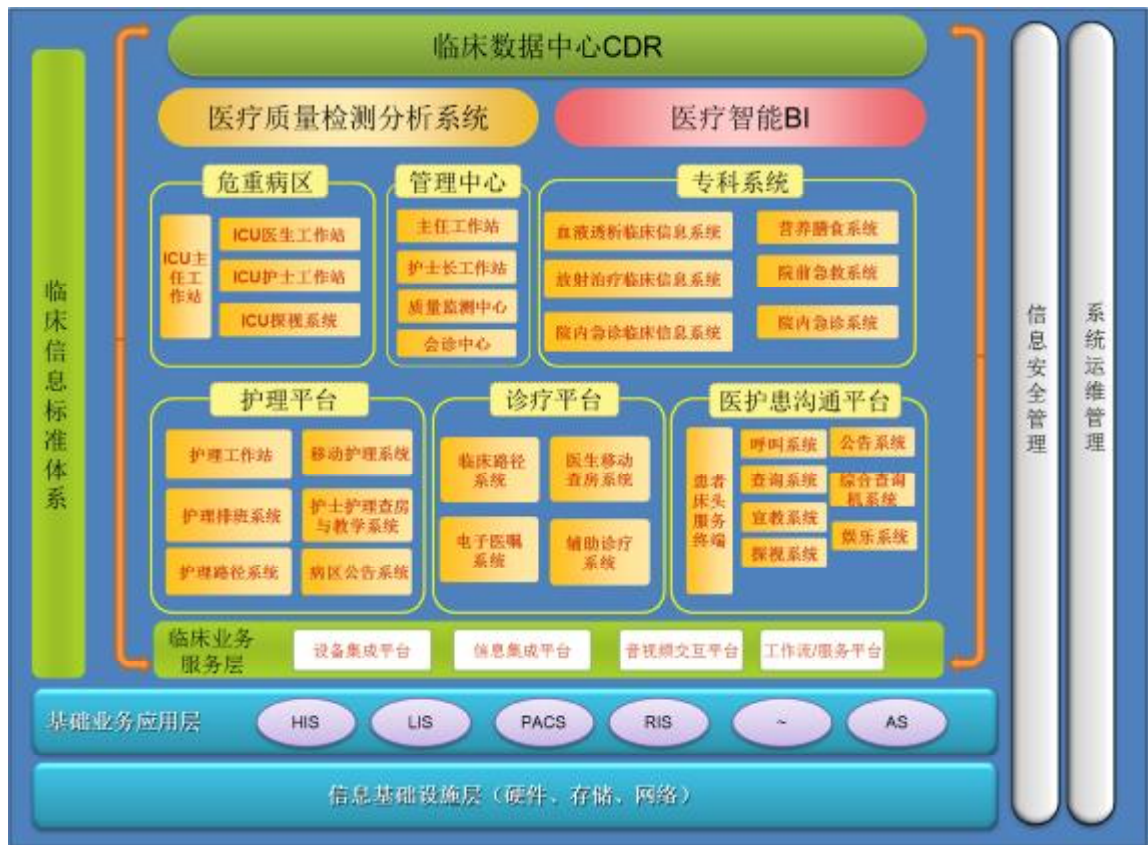
数字化病区整体规划图